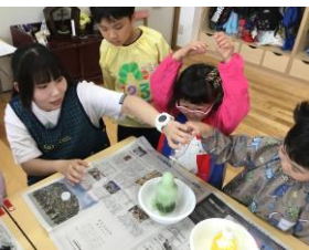
オープンシステム