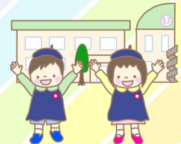
カメのげんき君 (玄関にいるよ!)