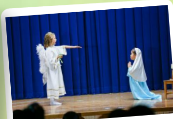
クリスマス遊戯会 (聖劇)